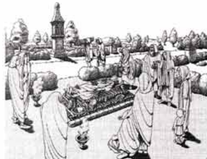
Totenfeier am Schirenhof