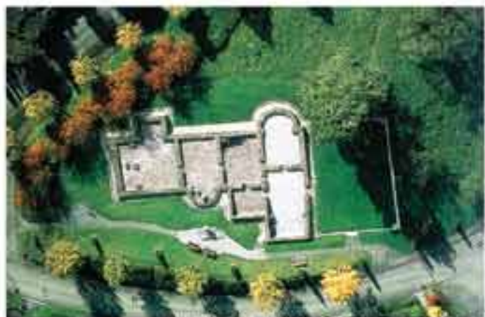
Luftbild und Modell des Kohortenlagers Schirenhof