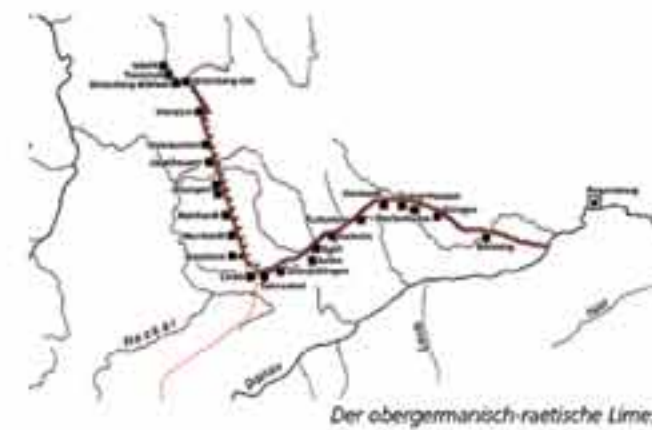
Der obergermanisch-raetische Limes

Zu beiden Seiten des Rotenbachtals wurde die inner-römische Provinzgrenze von ungewöhnlich dicht platzierten Kastellanlagen gesichert. Auffallend ist auch der mit etwa 6 km äußerst geringe Abstand zwischen dem obergermanischen Kastell in Lorich und dem raetischen Militärplatz bei Schwäbisch Gmünd.