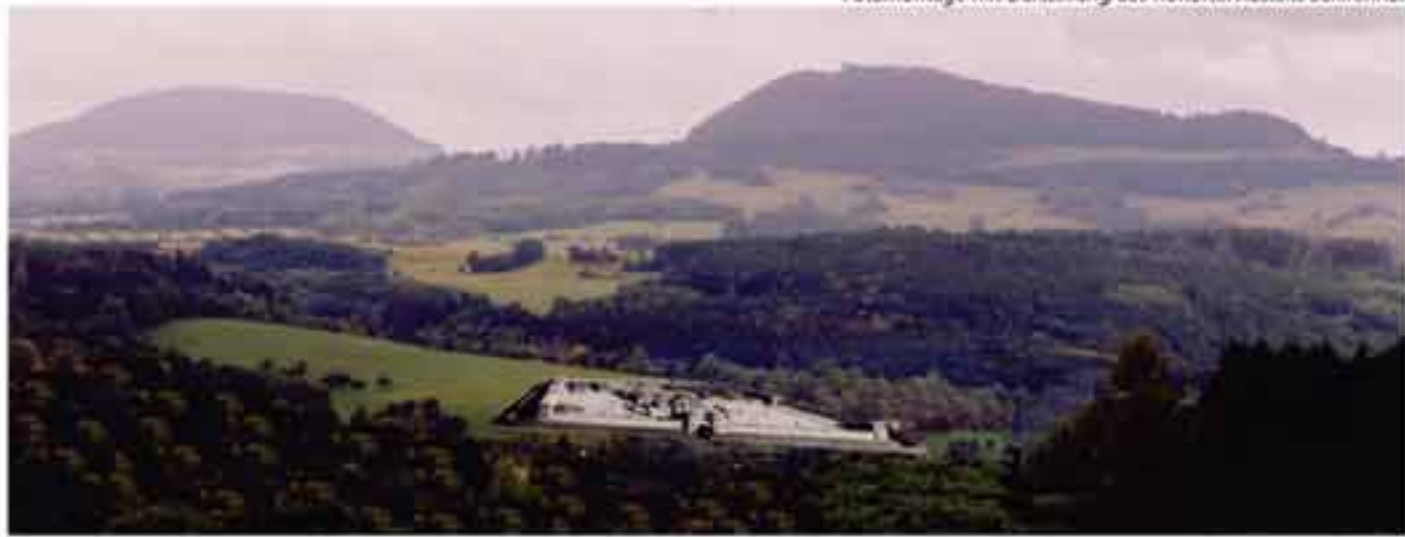
Fotomontage mit Darstellung des Kohortenkastells Schirenhof

Die Stadt Schwäbisch Gmünd hat 1975 die Grundmauern des Bades wiederherstellen lassen und der Öffentlichkeit zugänglich gemacht; 1999 wurde es von Grund auf renoviert.