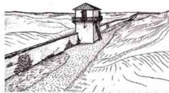
Die letzte Ausbaustufe des Limes in Raetien mit durchgehender Steinmauer und in die Mauer eingebauten Türmen

Anfang des 19. Jahrhunderts wurden die noch erhaltenen Baureste dieses Kleinkastells, auf die noch der alte Flurname "Schlöble" hinweist, eingeebnet. Von der Anlage - außerhalb des Rundwanderweges - sind heute obertägig keine Spuren mehr sichtbar.