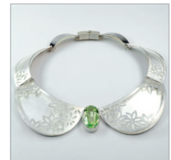
Berufskolleg für Design, Schmuck und Gerät www.gs-gd.de/schmuckdesign