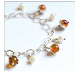
Jane Lyon Jewellery jjjewellery@online.de