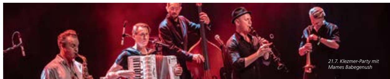
21.7. Klezmer-Party mit Mames Babegenush