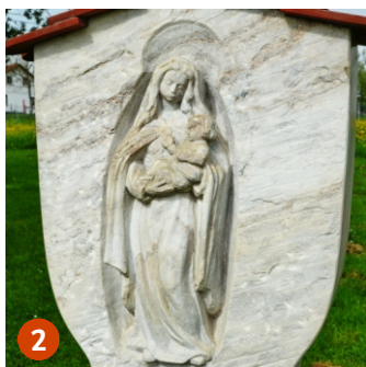
Madonna Materl* Eberhard Mangold 1985

Das schmiedeeiserne Kreuz auf einem gelben Sandsteinsockel stand ursprünglich auf dem Kirchhof, um die Wallfahrtskirche St. Jakobus, auf dem Hohenberg bei Ellwangen. Etwa um die selbe Zeit ließ der Lindenhofbauer hier in Bettringen die Felixkapelle errichten.