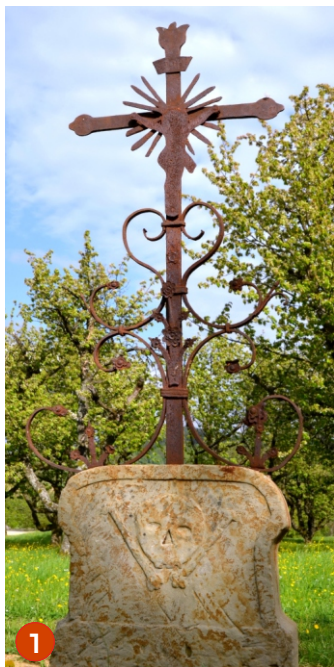
Hohenberger Kreuz* um 1720

Das schmiedeeiserne Kreuz auf einem gelben Sandsteinsockel stand ursprünglich auf dem Kirchhof, um die Wallfahrtskirche St. Jakobus, auf dem Hohenberg bei Ellwangen. Etwa um die selbe Zeit ließ der Lindenhofbauer hier in Bettringen die Felixkapelle errichten.