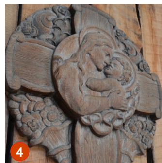
Mutter mit Kind* Werkstatt Geiselhart um 1904

Der Bildstock entstand in der Töpferwerkstatt der Vinzenz-von-Paul-Werkstatt, die Ines Greiner Ende der achtziger Jahre leitete. Vier glasierte Tontafeln zeigen Szenen zu den Hauptfesten im Kirchenjahr: Die Geburt Christi verweist auf Weihnachten. Das letzte Abendmahl (Gründonnerstag) und die Kreuzigungsszene (Karfreitag) kündigen die Auferstehung Christi zu Ostern an. Die vierte Tafel thematisiert Pfingsten, die Geburtsstunde der Kirche.