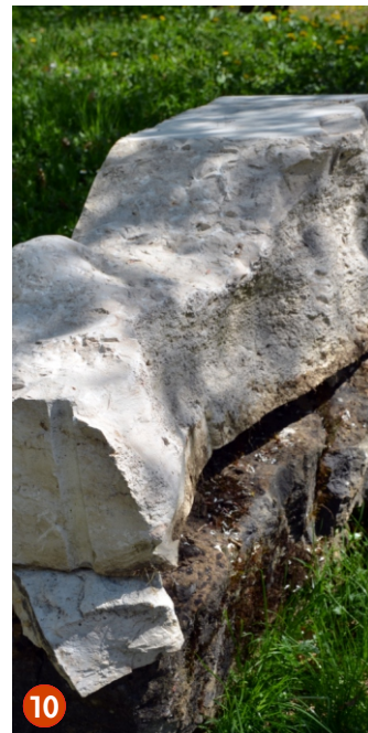
Werkstein Jura Dolomit mit Fäustel und Eisen