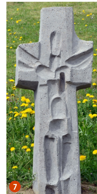
Corpus* Sieger Köder 1962