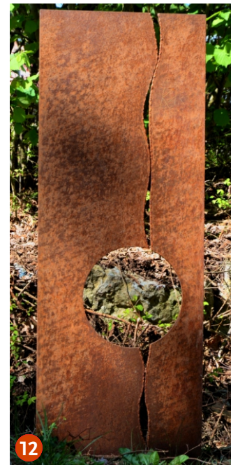
Lemniskate* Eberhard Mangold 1995

Der Friedensengel aus Palissandro steht als Zeichen auf dem unteren Eingang am „Weg zum Guten Hirten“. Gemäß dem Gruß des Heiligen Franziskus „Pace e bene“ - Friede und Gutes - begrüßen die Bewohner der Häuser Gabriel, Michael und Raphael alle Wanderer als Gäste und heißen sie herzlich willkommen.