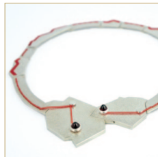
Berufskolleg für Design, Schmuck und Gerät www.gs-gd.de/schmuckdesign